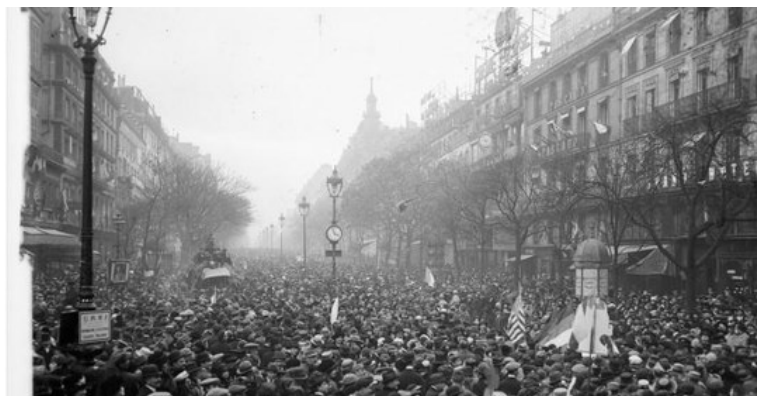
Les grands boulevards à Paris le jour de l'armistice du 11 novembre 1918

Ces instants partagés rappellent combien l'histoire et la solidarité restent au cœur de la vie de notre village.